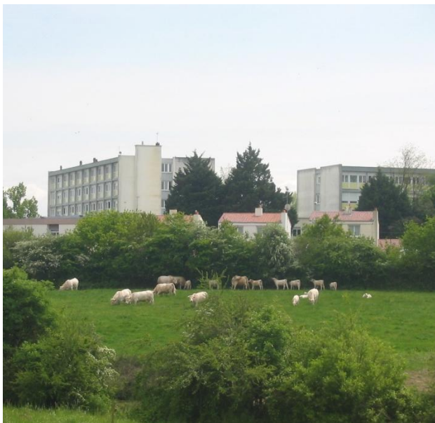
Respecter l'équilibre entre espaces ouverts et urbanisés : une clé de l'attractivité des territoires

Ceci ne peut qu'affaiblir progressivement l'agriculture, composante importante de l'économie régionale, et compromettre l'équilibre entre les espaces ouverts et les espaces urbanisés, jugé pourtant indispensable pour l'aménagement et l'attractivité de la région.