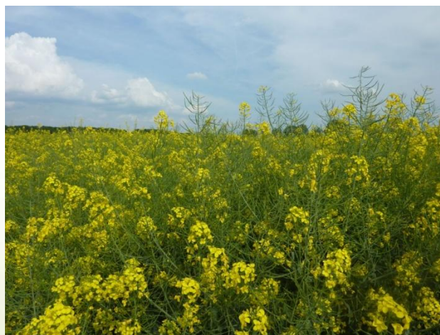
Les oléagineux occupent 76500 ha en 2010 soit 13,4% de la SAU régionale.

Concernant le premier point, la société CNT s'engage à faire acquérir chaque année par la société DIESTER auprès des coopératives agricoles d'Ile de France une quantité minimale de 200 tonnes de graines de cultures oléagineuses, destinées à être utilisées dans le processus de fabrication de produits émulsifiants et enrobés végétaux.