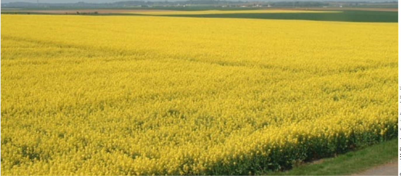
Bonnard M. Chambre d'agriculture de Vendée

Favorisée par les projets d'usage énergétique et industriel, la surface en colza a augmenté de 34 % dans les exploitations spécialisées entre 2000 et 2010.